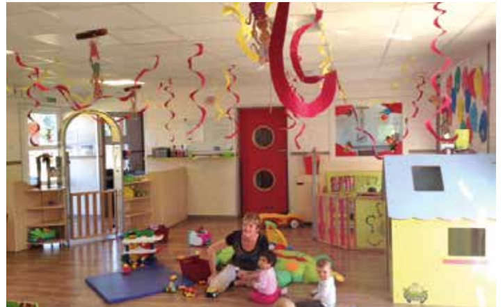
exemple de crèche GB2S à Pierrelatte (Drôme)