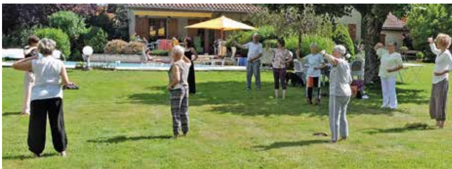
Exercice en plein air chez des amis Thodurois